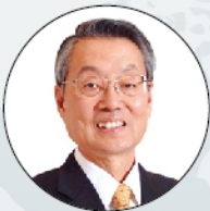
施振榮 台灣品牌之父 宏碁集團創辦人

「經營品牌，首重品牌價值，而要創造品牌價值，就是要經營相關的智財，從品牌的商標保護到不斷創新的著作權、專利、營業機密等，品牌價值可以說就是智財的經營與累積。」